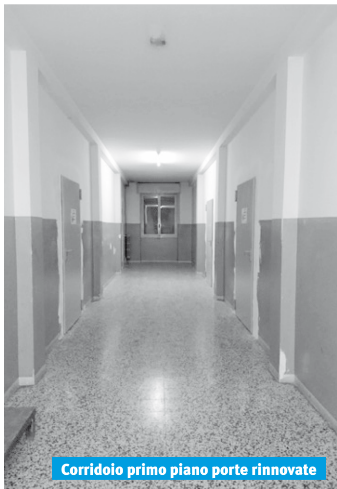
Corridoio primo piano porte rinnovate