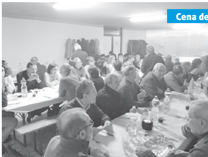
Cena dei volontari

Il costo preventivato, di circa tremila euro, non era facilmente perseguibile solo con il suddetto margine per questo lo sforzo della raccolta è stato esteso alle attività estive del "graffia e vinci" e del "pozzo" con il coinvolgimento dei catechisti. L'unione di questi sforzi ha portato alla realizzazione del progetto, per il quale però un contributo altrettanto significativo in termini di