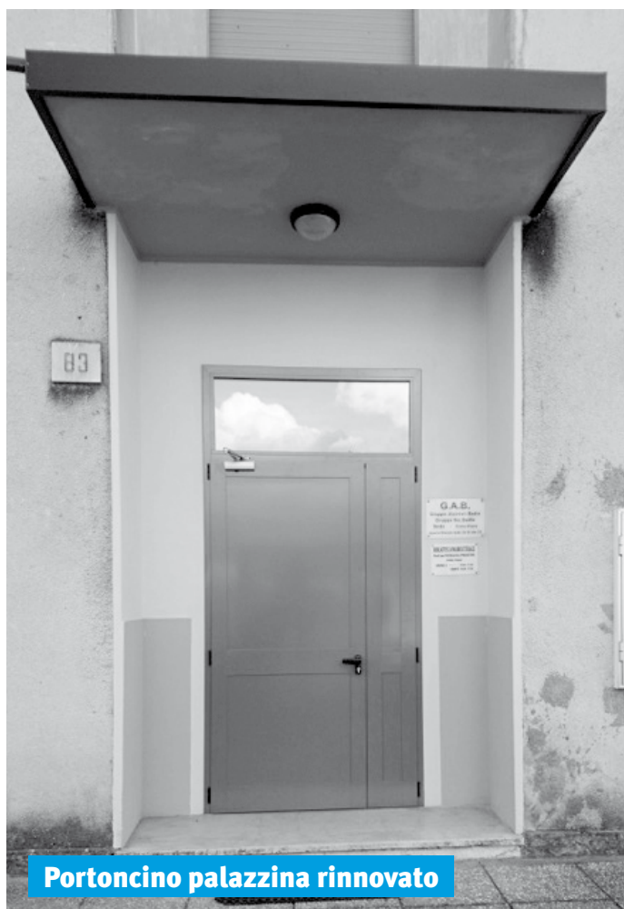
Portoncino palazzina rinnovato